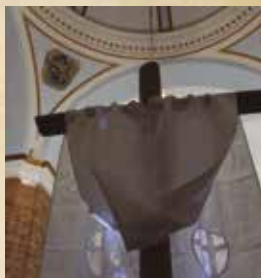
Autor Carlos Fernández Fernández