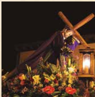
Autor Carlos Fernández Fernández