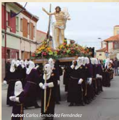
Autor: Carlos Fernández Fernández

Avenida el Romeral, calle Corpus Christi, Iglesia Parroquial.