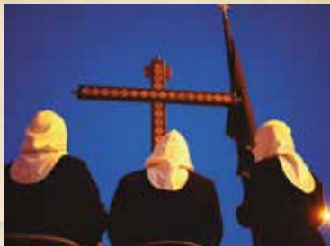
Autor Carlos Fernández Fernández

Momento de preparación, a través de la oración y la meditación, para vivir con intensidad los actos que viviremos recordando la Pasión, Muerte y Resurrección de Jesucristo.